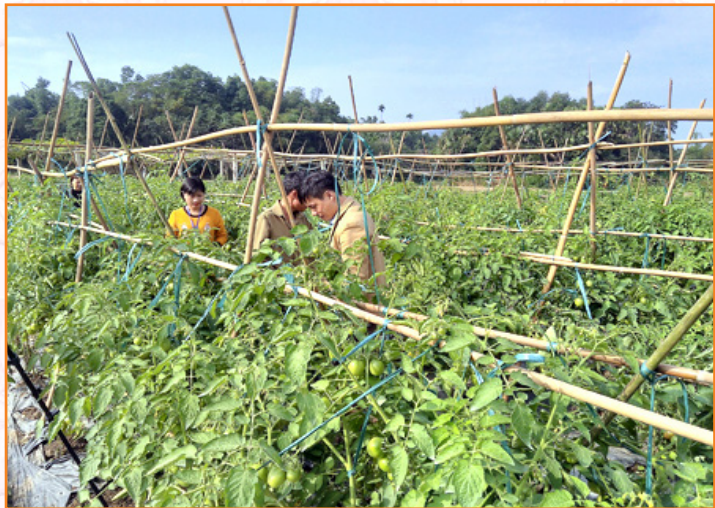
Mô hình trình diễn trồng cà chua Mỹ tại thôn Đàm Vông, xã Âu Lâu (2017)

Vụ Đông năm 2017, xây dựng mô hình trình diễn giống cà chua Mỹ, tại thôn Đàm Vông, xã Âu Lâu đem lại hiệu quả cao so với cây rau màu khác, đặc biệt trồng trong nhà lưới hiệu quả đem lại cao hơn, không phải phun bất cứ một loại thuốc bảo vệ thực vật nào.