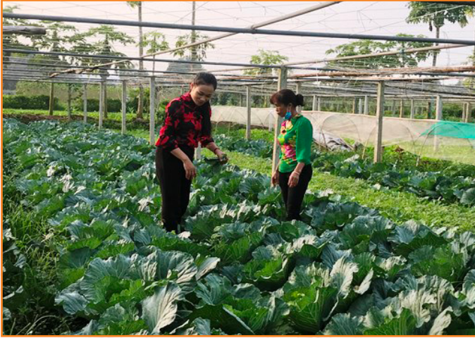
Cán bộ Trung tâm hướng dẫn kỹ thuật chăm sóc cây rau vụ Đông cho người dân xã Tuy Lộc (12/2020)

4. Nhằm giúp người dân nâng cao giá trị thu nhập trên một đơn vị diện tích đất canh tác, đồng thời, góp phần tích cực trong việc triển khai Đề án Phát triển sản xuất nông nghiệp hàng hóa, chất lượng cao gắn với xây dựng nông thôn mới và phát triển đô thị thành phố Yên Bái giai đoạn 2016 -