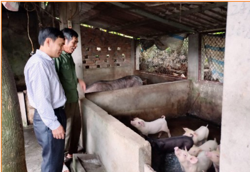
Cán bộ Trung tâm kiểm tra, hướng dẫn người dân chăn nuôi lợn kỹ thuật phòng chống rét tại phường Nam Cường, thành phố Yên Bái (11/2022)