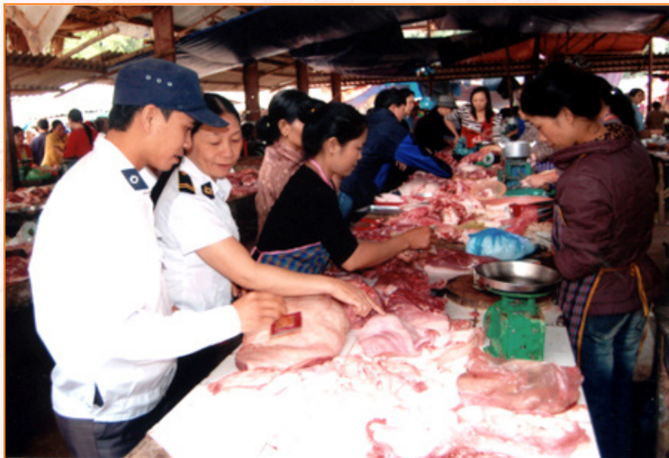
Cán bộ thú y thành phố Yên Bái kiểm dịch gia cầm và kiểm soát hoạt động giết mổ lợn tại chợ Bến Đò, phường Yên Ninh (11/2010)