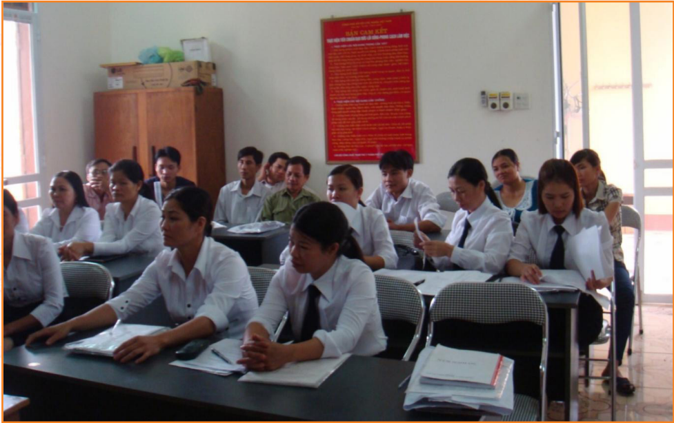
Trạm Thú y thành phố Yên Bái họp triển khai công tác tiêm phòng vắc xin phòng bệnh cho đàn vật nuôi (01/2012)

Đặc biệt chú trọng công tác phòng, chống một số dịch bệnh truyền nhiễm nguy hiểm như: