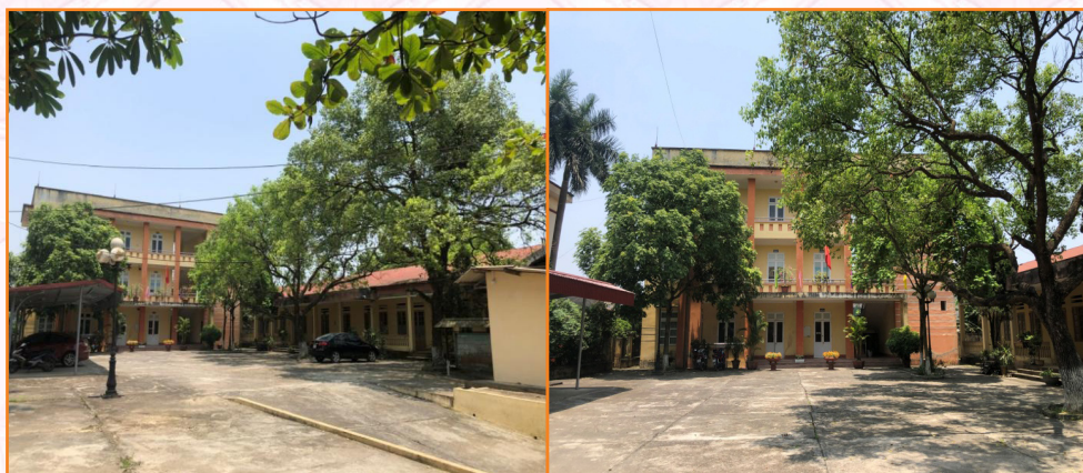
Trụ sở Trung tâm Dịch vụ, Hỗ trợ phát triển nông nghiệp thành phố Yên Bái Địa chỉ: số 343, đường Hòa Bình, phường Hồng Hà, thành phố Yên Bái, tỉnh Yên Bái