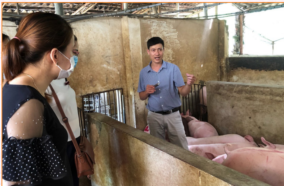
Viên chức Trung tâm tập huấn chuyên môn chăn nuôi năm 2021