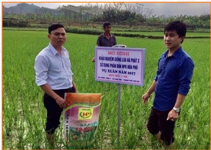
Trạm Khuyến nông phối hợp thực hiện mô hình khảo nghiệm giống lúa Hà Phát 3 tại xã Văn Phú (2017)

Năm 2016 - 2017: Mô hình Ứng dụng hệ canh tác lúa cải tiến SRI tại xã Âu Lâu; Đề án sản xuất rau an toàn trên địa bàn thành phố.