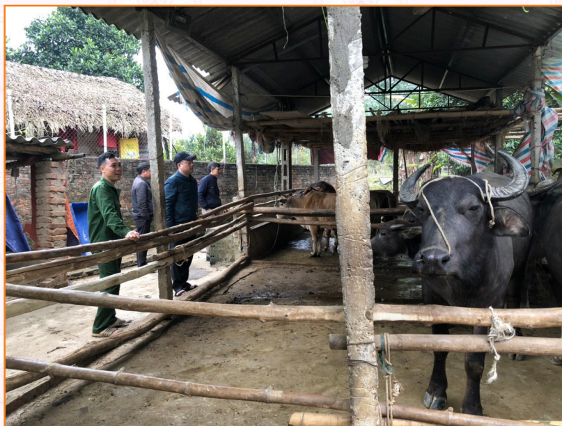
Lãnh đạo, viên chức Trung tâm kiểm tra công tác phòng chống dịch bệnh cho trâu, bò trên địa bàn phường Hợp Minh (2023)