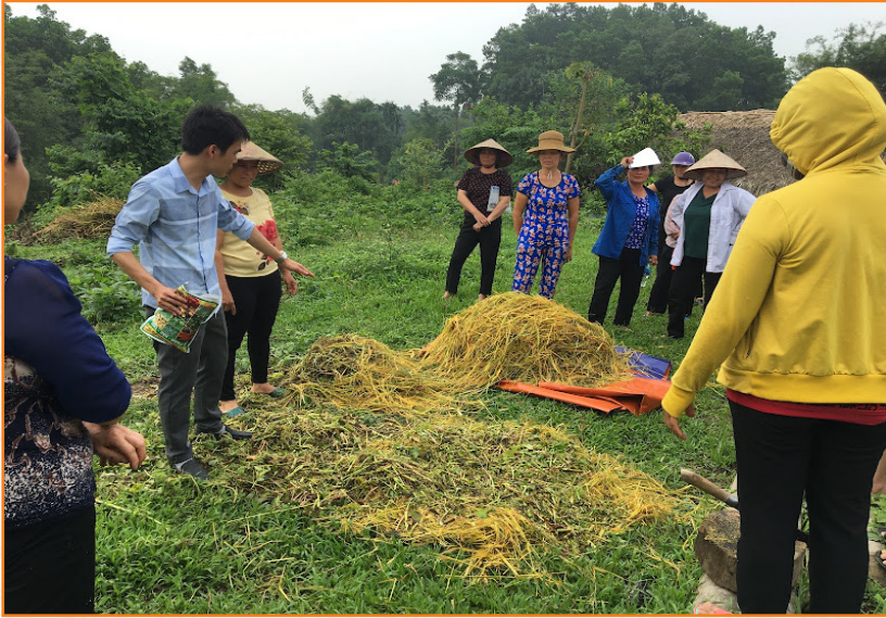
Hướng dẫn quy trình ủ phân hữu cơ cho các hộ tham gia Dự án phát triển sản xuất theo chuỗi giá trị gắn với tiêu thụ sản phẩm rau an toàn thành phố Yên Bái tại xã Tuy Lộc (2020)