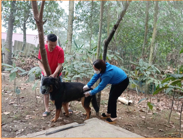
Cán bộ thú y tiêm phòng bệnh dại chó tại phường Nguyễn Phúc (2019)

Công tác kiểm soát giết mổ (KSGM) được thực hiện thường xuyên nên đã góp phần kiểm soát được dịch bệnh và đảm bảo vệ sinh thực phẩm cho con người. Thực hiện KSGM trên 700.000 con gia súc, gia cầm; kiểm tra vệ sinh thú y tại điểm kinh doanh, cơ sở giết mổ, chăn nuôi trên 9.000 lượt.