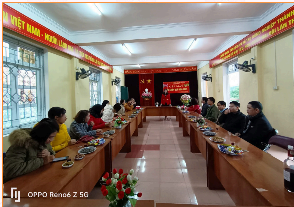
Tổ chức gặp mặt đầu xuân Quý Mão 2023