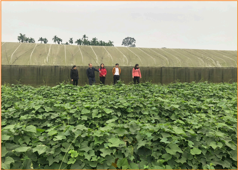
Lãnh đạo, viên chức Trung tâm kiểm tra sản xuất vùng rau an toàn tại thôn Cống Đá, xã Âu Lâu (2023)

Tiếp tục phối hợp với UBND các xã Tuy Lộc, Âu Lâu, Văn Phú duy trì “Dự án phát triển sản xuất liên kết theo chuỗi giá trị gắn sản xuất với tiêu thụ sản phẩm rau an toàn thành phố Yên Bái”.