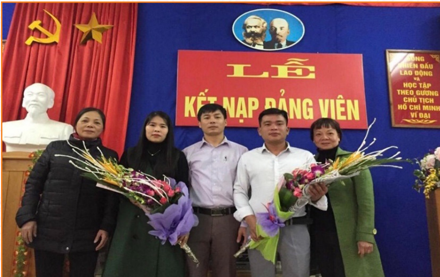
Lễ Kết nạp đảng viên năm 2017