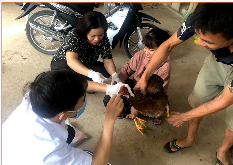
Lấy mẫu xét nghiệm cúm gia cầm định kỳ hàng năm (2021)

Phòng chống dịch bệnh phát sinh trên địa bàn: Tất cả các ổ dịch đều được phát hiện sớm và xử lý kịp thời, không để dịch bệnh lây lan trên diện rộng.