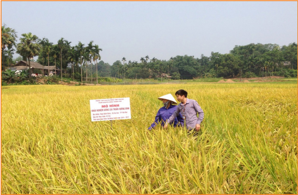
Đ/c Lương Anh Lập - Trạm Khuyến nông kiểm tra, đánh giá mô hình khảo nghiệm giống lúa Hương Bình tại xã Âu Lâu (2017)

Vụ Đông năm 2017, xây dựng mô hình trình diễn giống cà chua Mỹ, tại thôn Đàm Vông, xã Âu Lâu đem lại hiệu quả cao so với cây rau màu khác, đặc biệt trồng trong nhà lưới hiệu quả đem lại cao hơn, không phải phun bất cứ một loại thuốc bảo vệ thực vật nào.