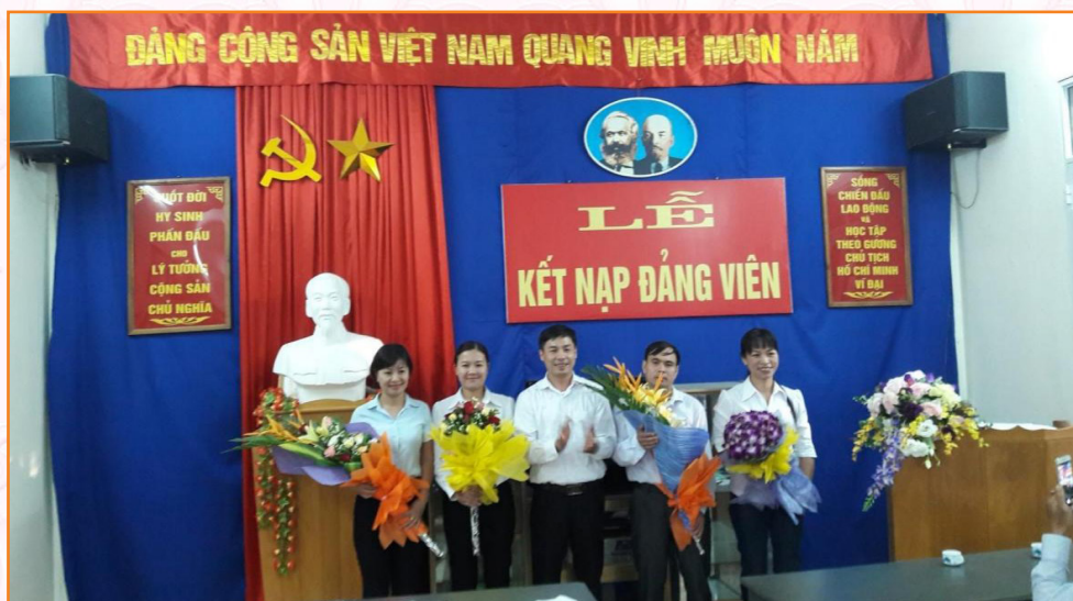
Lễ Kết nạp đảng viên năm 2016

Đến tháng 10/2016, Chi bộ đã kết nạp thêm 04 đảng viên mới, nâng tổng số đảng viên của Chi bộ lên 24 đồng chí.