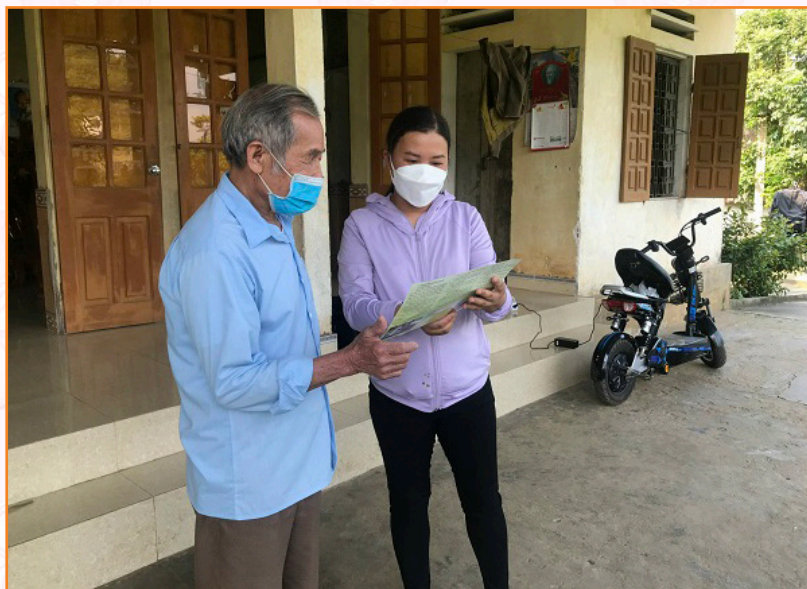
Viên chức Trung tâm tuyên truyền lợi ích việc tiêm vắc xin đối với vật nuôi cho người dân (5/2022)