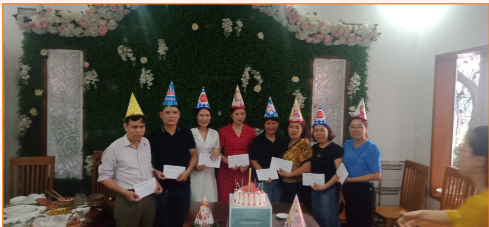
Công đoàn tổ chức sinh nhật năm 2019