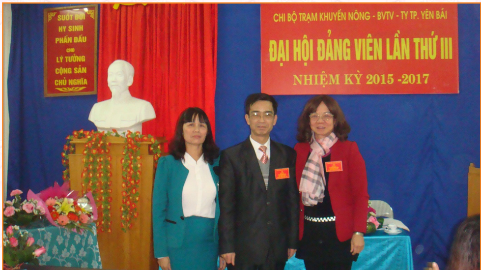
Chi ủy khóa III, nhiệm kỳ 2015 - 2017