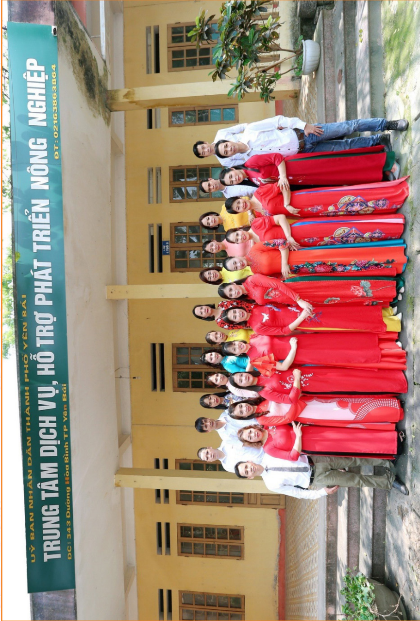
Tập thể cán bộ, viên chức Trung tâm Dịch vụ, Hỗ trợ phát triển nông nghiệp thành phố Yên Bái (Tháng 12 năm 2022)