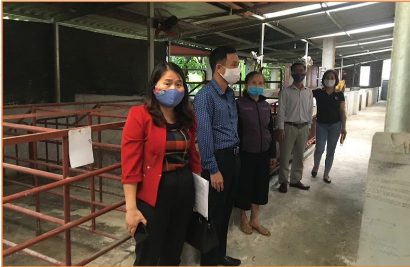
Phối hợp với Phòng Kinh tế thành phố kiểm tra, chỉ đạo công tác phòng chống dịch tả lợn châu Phi (2019)

8. Công tác triển khai thực hiện các chuỗi liên kết sản xuất nông nghiệp, gắn sản xuất với tiêu thụ sản phẩm: Là cơ quan chủ trì, tham mưu cho UBND thành phố Yên Bái tổ chức thực hiện Dự án “Phát triển sản xuất liên kết theo chuỗi giá trị gắn sản xuất với tiêu thụ sản phẩm rau an toàn thành phố Yên Bái” trên địa bàn 03 xã Tuy Lộc, Âu Lâu và Văn Phú.