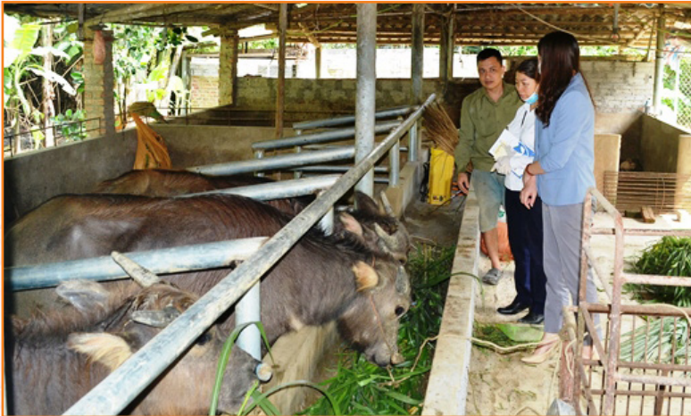
Cán bộ Trung tâm hướng dẫn nhân dân kỹ thuật phòng, chống dịch bệnh cho trâu của hộ dân ở xã Văn Phú (17/4/2021)