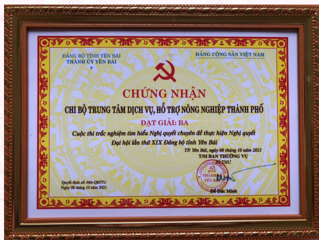
Chi bộ đạt giải Ba trong Cuộc thi trắc nghiệm tìm hiểu Nghị quyết chuyên đề thực hiện Nghị quyết Đại hội lần thứ XIX Đảng bộ tỉnh Yên Bái (2021)