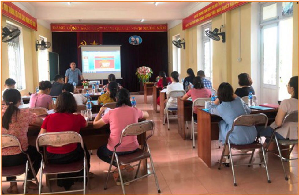
Cán bộ, viên chức Trung tâm tham gia tập huấn chuyên môn về chăn nuôi lợn, kỹ thuật phòng và điều trị bệnh trên lợn (2022)