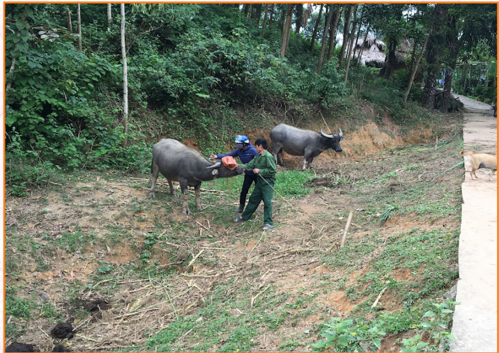
Cán bộ thú y tiêm phòng cho đàn trâu tại thôn Minh Long, xã Tuy Lộc (2019)

giao, cụ thể: Trên đàn trâu, bò vắc xin lở mồm long móng trên 7.700 liều, vắc xin tụ huyết trùng trên 4.400 liều; trên đàn lợn vắc xin dịch tả, tụ huyết trùng, phó thương hàn trên 57.000 liều; trên đàn chó mèo vắc xin dại xấp xỉ 35.000 liều.