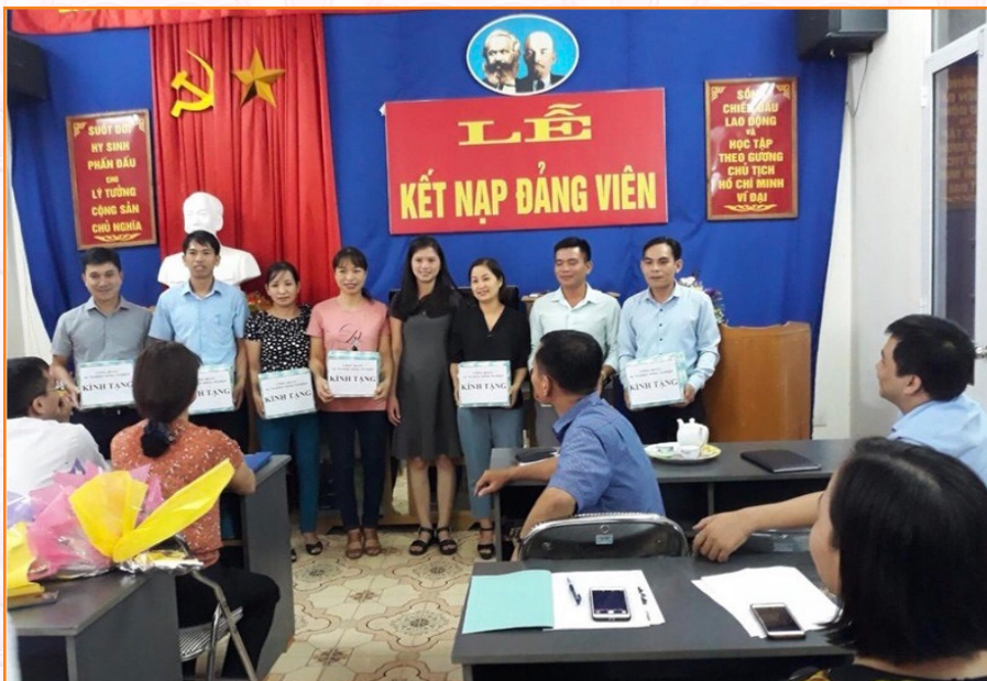
Lễ kết nạp đảng viên và tặng quà chia tay các đồng chí chuyển công tác (2018)