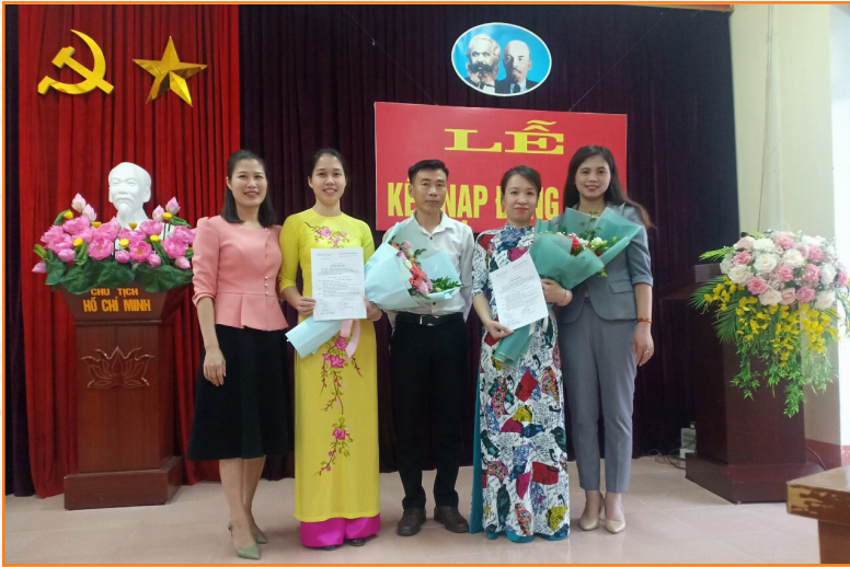
Lễ Kết nạp đảng viên năm 2020

Thực hiện có hiệu quả Kế hoạch hành động số 25-KH/TU, ngày 25/12/2020 của Thành ủy Yên Bái; Kế hoạch triển khai học tập Nghị quyết Đại hội Đảng các cấp; Kế hoạch thực hiện Chỉ thị số 05-CT/TW, năm 2021; Kế hoạch thực hiện kế hoạch số 42-KH/TU, ngày 22/3/2021 của Thành ủy Yên Bái về xây dựng, nhân rộng các mô hình, điển hình tiên tiến học tập và làm theo tư tưởng, đạo đức, phong cách Hồ Chí Minh giai đoạn 2021 - 2025; Kế hoạch thực hiện Kết luận số 01-KL/TW, ngày 18/5/2021 của Bộ Chính trị về tiếp tục thực hiện Chỉ thị số 05-CT/TW về “Đẩy mạnh học tập và làm theo tư tưởng, đạo đức, phong cách Hồ Chí Minh” giai đoạn 2021 - 2025; đăng ký và xây dựng các mô hình điển hình tiên tiến.