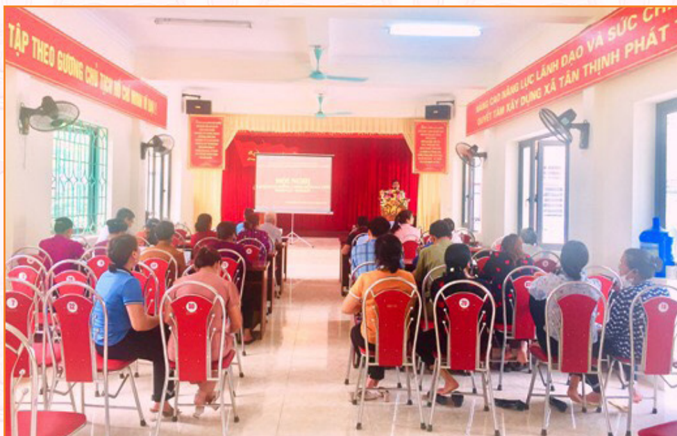
Trung tâm tổ chức tập huấn phòng, chống bệnh dại tại xã Tân Thịnh năm 2022