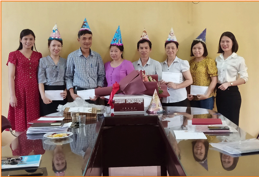
Công đoàn tổ chức sinh nhật năm 2018

tạo được không khí phấn khởi, đoàn kết, hăng say công tác, tích cực thi đua phấn đấu hoàn thành các nhiệm vụ được giao trong tập thể viên chức, người lao động. Qua đó, kết quả công tác được nâng lên rõ rệt. Môi trường và phong cách làm việc được đổi mới và không ngừng nâng cao.