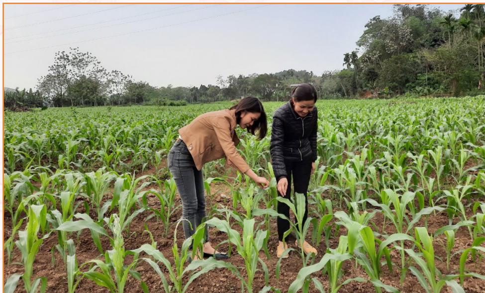
Cán bộ Trung tâm kiểm tra tình hình sâu bệnh hại trên cây ngô vụ Xuân tại xã Văn Phú, thành phố Yên Bái (2022)