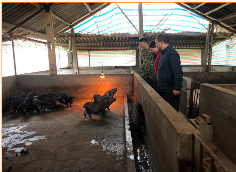
Lãnh đạo, viên chức Trung tâm kiểm tra công tác phòng chống rét cho đàn lợn trên địa bàn phường Hợp Minh (2023)