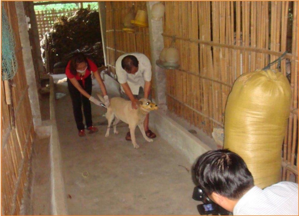
Thú y cơ sở thực hiện tiêm phòng vắc xin dại (2014)

Công tác kiểm soát giết mổ, kiểm tra vệ sinh thú y được thực hiện có hiệu quả, đảm bảo vệ sinh thú y, an toàn thực phẩm cho người tiêu dùng.