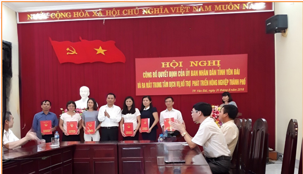
Hội nghị công bố Quyết định thành lập Trung tâm Dịch vụ, Hỗ trợ phát triển nông nghiệp thành phố Yên Bái (8/2018)