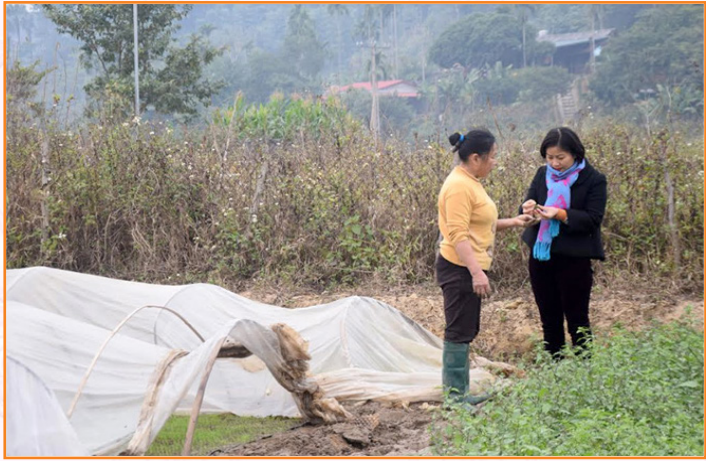
Cán bộ Trung tâm trao đổi, hướng dẫn người dân kỹ thuật phòng, chống rét cho mạ vụ Đông - Xuân (2021)

Trong công tác thông tin tuyên truyền: Thực hiện tập huấn, hướng dẫn kỹ thuật đầu bờ cho 7.000 lượt hộ nông dân; ra 20 dự báo, thông báo về công tác bảo vệ thực vật; 260 thông báo về lịch thời vụ, cơ cấu giống cây