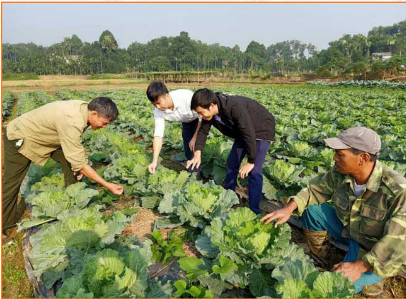
Viên chức Trung tâm kiểm tra sản xuất rau an toàn tại thôn Công Đá, xã Âu Lâu (2019)