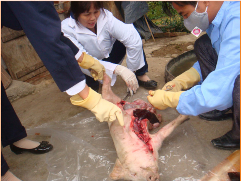
Cán bộ Trạm Thú y mổ khám chẩn đoán dịch bệnh (21/11/2013)

Hàng năm, công tác phòng, chống bệnh dại cho đàn chó mèo; bệnh lở mồm long móng gia súc; bệnh tụ huyết trùng trâu bò; bệnh dịch tả, tụ huyết trùng, phó thương hàn lợn; bệnh cúm gia cầm...được triển khai thực hiện rất tốt, không xảy ra dịch bệnh đối với các bệnh đã được tiêm phòng; góp phần thúc đẩy chăn nuôi trên địa bàn phát triển ổn định.