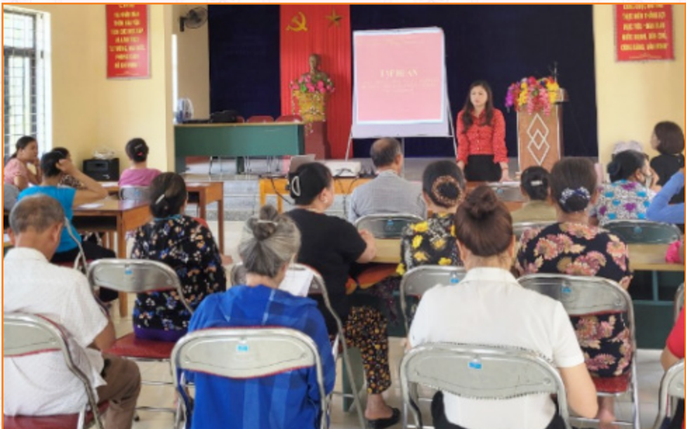
Tập huấn kỹ thuật chăm sóc, phòng trị bệnh cho đàn gia súc, gia cầm tại xã Minh Bảo (2022)