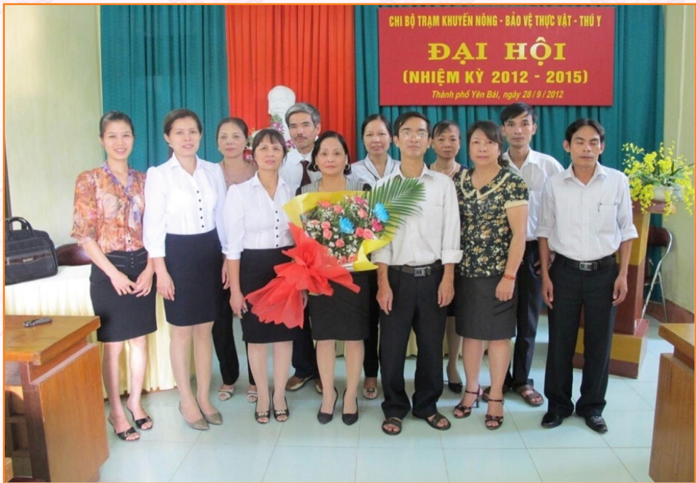
Đại hội Chi bộ Trùm Khuyến nông - Bảo vệ thực vật - Thú y, nhiệm kỳ 2012 - 2015