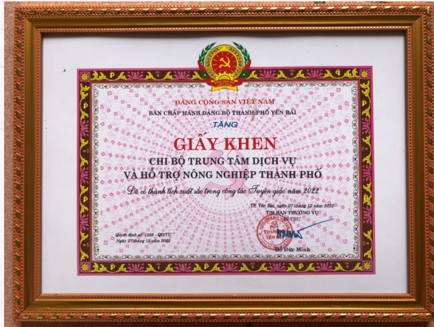
Chi bộ được tặng Giấy khen có thành tích xuất sắc trong công tác Tuyên giáo năm 2022