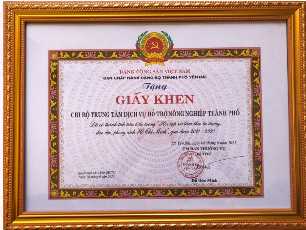
Chi bộ được tặng Giấy khen có thành tích tiêu biểu trong “Học tập và làm theo tư tưởng, đạo đức, phong cách Hồ Chí Minh”, giai đoạn 2021 - 2023