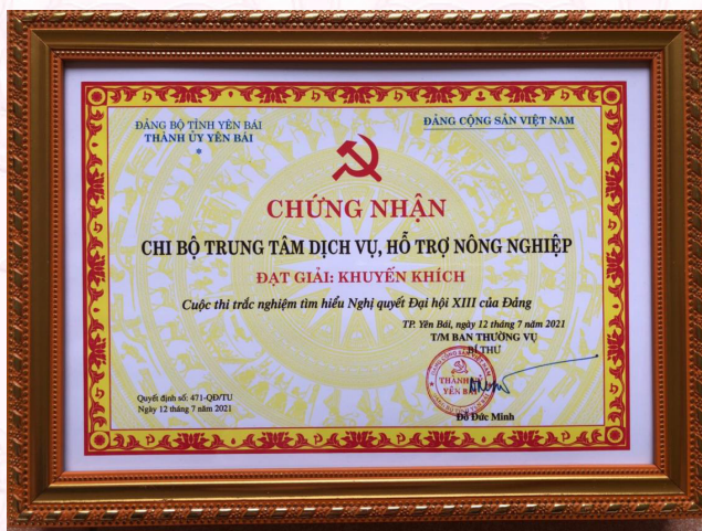
Chi bộ đạt giải Khuyến khích trong Cuộc thi trắc nghiệm tìm hiểu Nghị quyết Đại hội XIII của Đảng (2021)