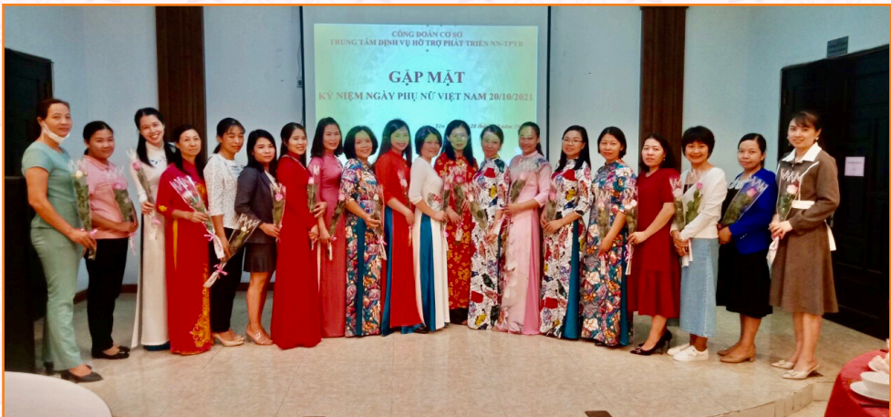
Công đoàn Trung tâm tổ chức kỷ niệm ngày Phụ nữ Việt Nam 20/10 (2020)