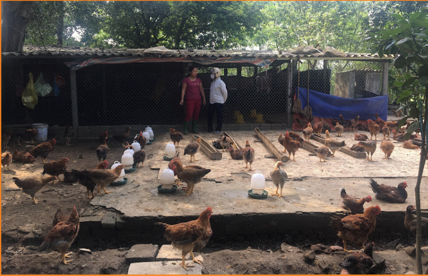
Cán bộ thú y kiểm tra, hướng dẫn người dân kỹ thuật chăm sóc và phòng bệnh gia cầm tại thôn Hợp Thành, xã Tuy Lộc (2019)

Tổ chức tiêm phòng các bệnh bắt buộc cho đàn gia súc, gia cầm trên toàn địa bàn thành phố 2 đợt/năm (tháng 4, 5 và 10, 11) đều đạt tỷ lệ bảo hộ cao. Hàng năm, đều hoàn thành 100% chỉ tiêu kế hoạch tiêm phòng được