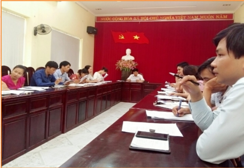
Trạm Khuyến nông họp triển khai các biện pháp khắc phục hậu quả sản xuất nông, lâm nghiệp, thủy sản sau mưa, bão (2016)

tai và ứng phó với biến đổi khí hậu; đặc biệt ảnh hưởng của cơn bão số 3, mưa lớn kéo dài từ 18 - 21/8/2016 gây ngập lụt.