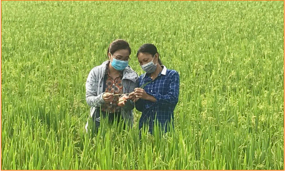
Viên chức Trung tâm hướng dẫn người dân xã Âu Lâu cách phát hiện sâu bệnh hại lúa Mùa (2022)