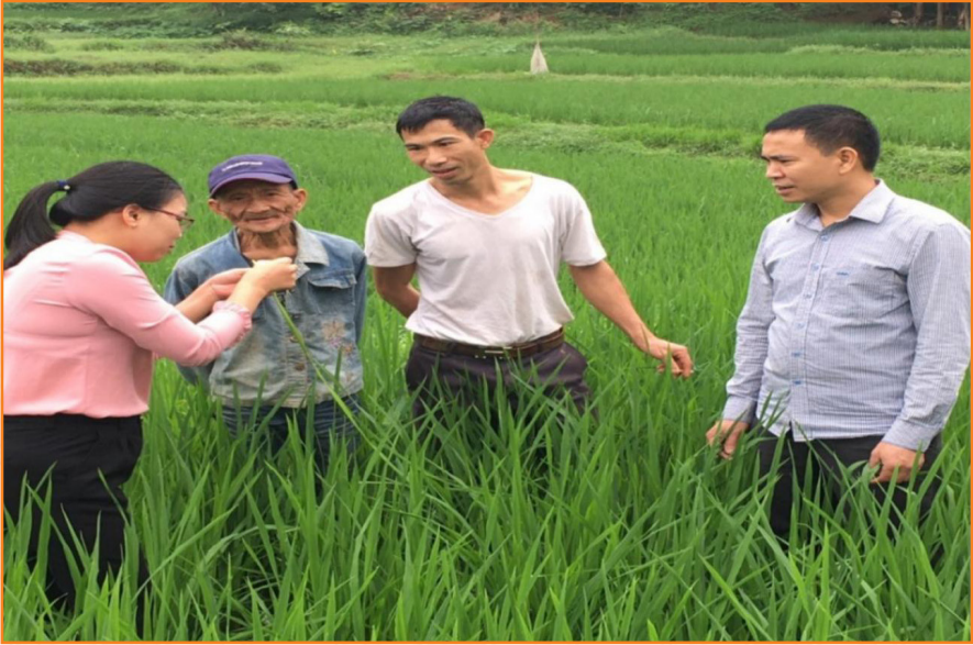
Viên chức Trung tâm kiểm tra, hướng dẫn kỹ thuật phòng, trừ sâu bệnh hại lúa Đông - Xuân (2019)