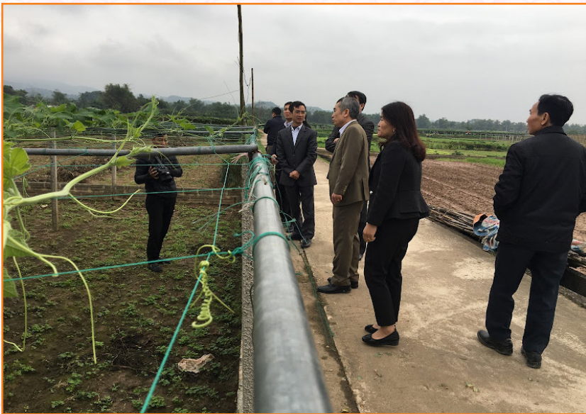
Lãnh đạo thành phố kiểm tra Dự án phát triển sản xuất theo chuỗi giá trị gắn với tiêu thụ sản phẩm rau an toàn thành phố Yên Bái tại xã Tuy Lộc (2020)