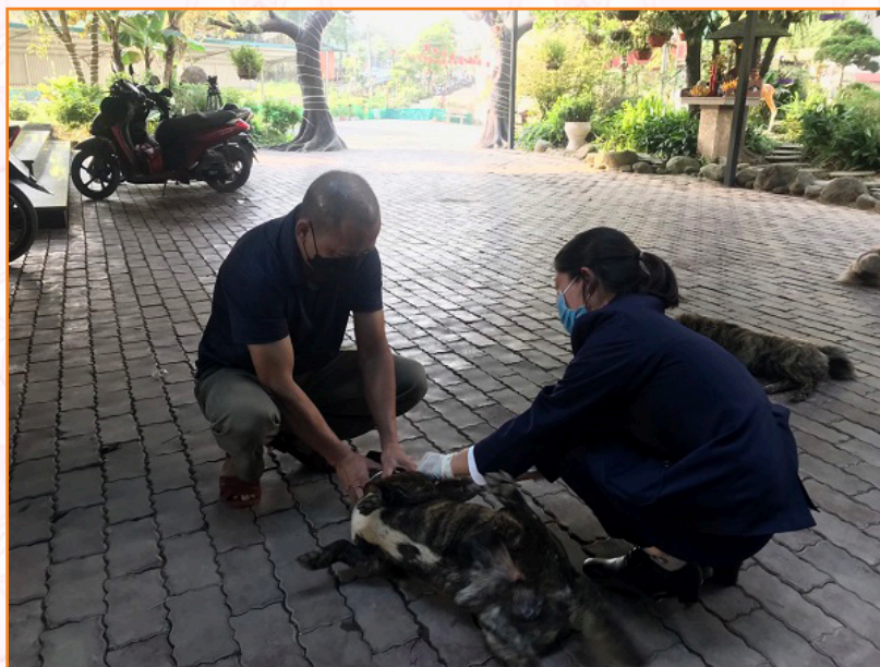
Tiêm vắc xin phòng dại trên địa bàn phường Đồng Tâm tháng (4/2022)