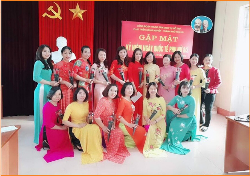
Công đoàn Trung tâm tổ chức kỷ niệm ngày Quốc tế phụ nữ 8.3 (2020)