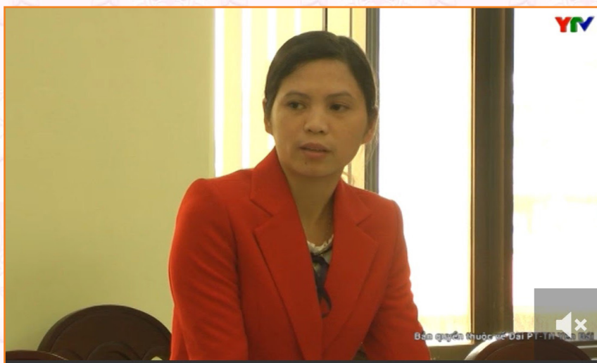
Hội nghị triển khai công tác phòng, chống dịch tả lợn châu Phi (3/2019)