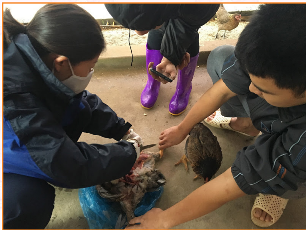
Cán bộ thú y lấy mẫu bệnh phẩm xét nghiệm dịch bệnh trên gia cầm tại xã Tuy Lộc (2021)

Dịch cúm gia cầm: Xảy ra 01 ổ dịch, tại 01 hộ thôn Minh Long, xã Tuy Lộc. Đã tiêu hủy 2.500 con gà 3 tháng tuổi.