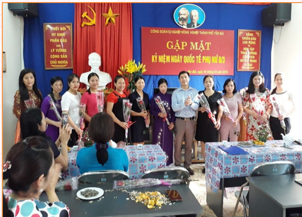
Công đoàn tổ chức gặp mặt kỷ niệm ngày Quốc tế phụ nữ 8/3 (2018)

Chi bộ Sự nghiệp nông nghiệp thành phố Yên Bái trực thuộc Thành ủy Yên Bái được thành lập, ngay sau đó Công đoàn cơ sở Sự nghiệp nông nghiệp thành phố Yên Bái được hình thành nhằm động viên tinh thần và trí tuệ của toàn thể cán bộ viên chức của 03 Trạm vào thực hiện nhiệm vụ chính trị của đơn vị - đáp ứng nhu cầu, nguyện vọng của đông đảo đoàn viên, phù hợp với thực tế trong hoạt động của hệ thống chính trị và các đoàn thể (Công đoàn cơ sở Sự nghiệp nông nghiệp thành phố Yên Bái được thành lập theo Quyết định số 232/QĐ-LĐLĐ ngày 19/10/2017 của Liên đoàn Lao động thành phố Yên Bái).