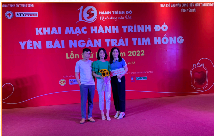
Cán bộ, viên chức tham gia Hành trình đỏ Yên Bái ngàn trái tim hồng (2022)