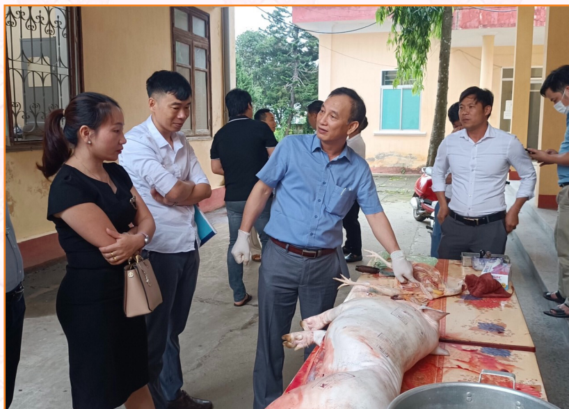
Cán bộ Trung tâm tham gia tập huấn nâng cao công tác kiểm soát giết mổ hàng năm (2019)