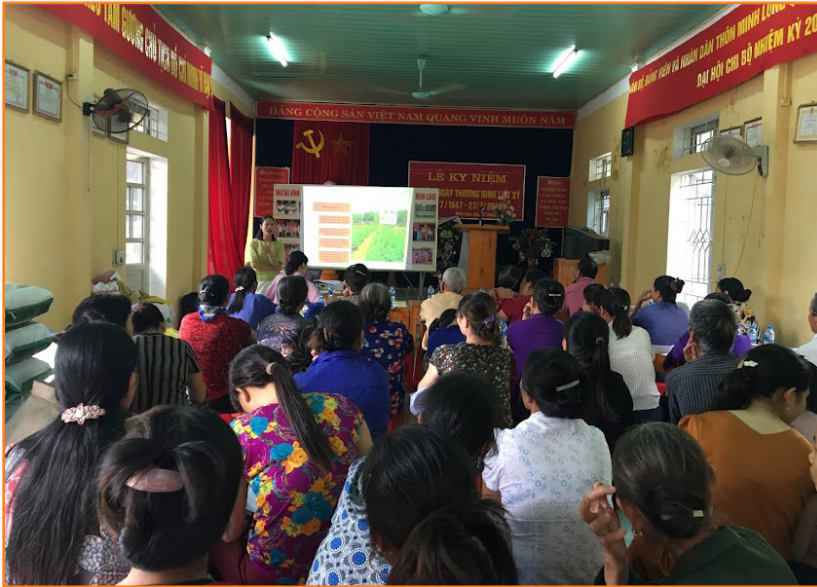
Tổ chức tập huấn kỹ thuật Dự án phát triển sản xuất theo chuỗi giá trị gắn với tiêu thụ sản phẩm rau an toàn thành phố Yên Bái tại xã Tuy Lộc (2019)