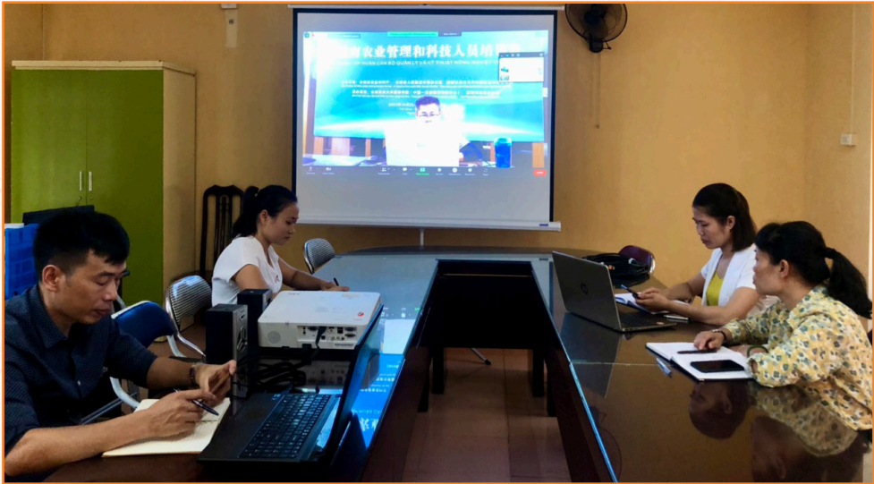
Cán bộ Trung tâm tham gia khóa tập huấn trực tuyến về kỹ thuật nông nghiệp công nghệ cao do Sở Nông nghiệp và Nông thôn tỉnh Vân Nam, Trung Quốc tổ chức (2022)