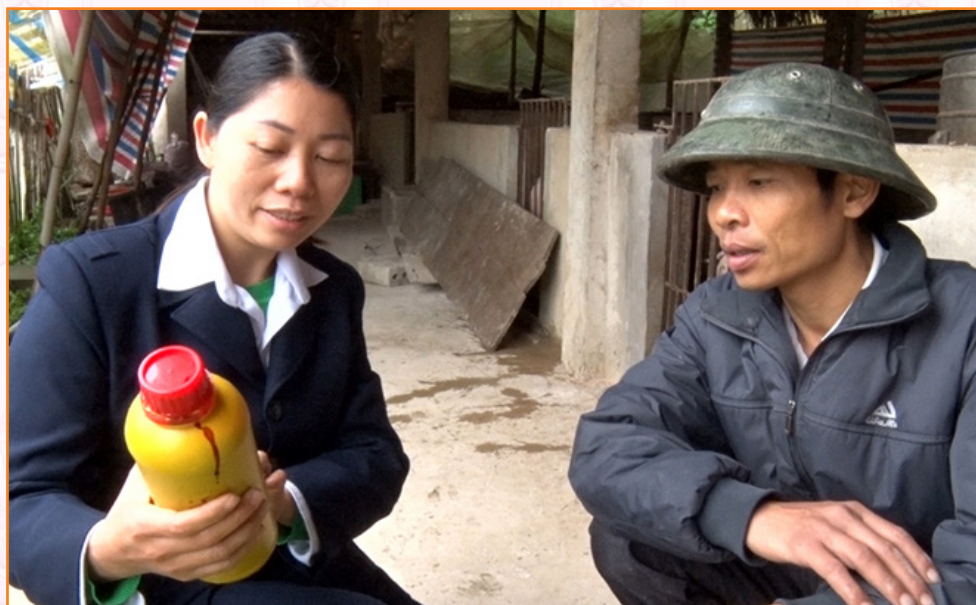
Cán bộ thú y hướng dẫn người chăn nuôi cách sử dụng thuốc phun khử trùng tiêu độc (2019)