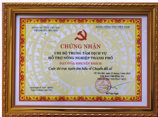
Chi bộ đạt giải Khuyến khích trong Cuộc thi trực tuyến tìm hiểu về Chuyển đổi số (2023)