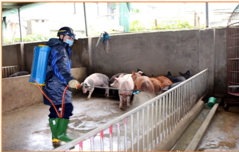
Cán bộ Trung tâm phun tiêu độc khử trùng trên địa bàn phường Nam Cường, thành phố Yên Bái (01/2019)

Dịch tả lợn châu Phi lần đầu tiên xuất hiện tại Việt Nam. Bệnh dịch tả lợn châu Phi là một bệnh truyền nhiễm nguy hiểm do vi rút gây ra, gây thiệt hại rất nặng nề cho ngành chăn nuôi. Tại