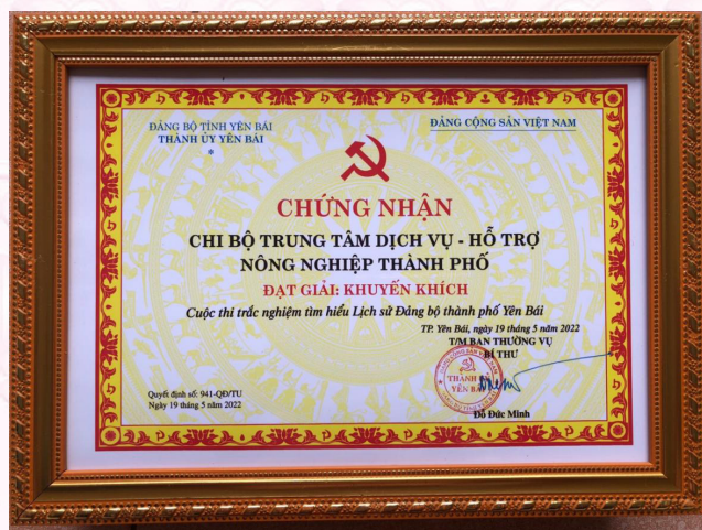
Chi bộ đạt giải Khuyến khích trong Cuộc thi trắc nghiệm tìm hiểu Lịch sử Đảng bộ thành phố Yên Bái (2022)