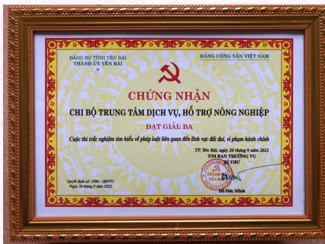
Chi bộ đạt giải Ba trong Cuộc thi trắc nghiệm tìm hiểu về pháp luật liên quan đến lĩnh vực đất đai, vi phạm hành chính (2022)