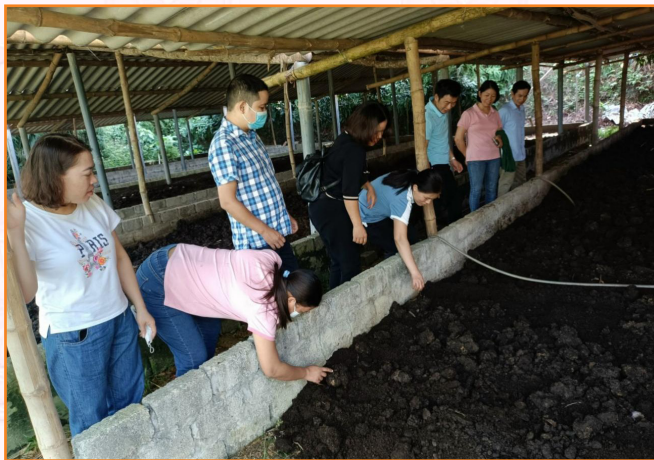
Cán bộ Trung tâm thăm quan và học tập kinh nghiệm mô hình nuôi trùn quế (2022)

Thực hiện tốt chức năng tham mưu cho UBND thành phố và các xã, phường về xây dựng kế hoạch sản xuất nông lâm nghiệp theo mùa vụ, lựa chọn và hướng dẫn kỹ thuật cho các hộ tham gia các dự án, đề án của tỉnh và thành phố trong năm 2022.