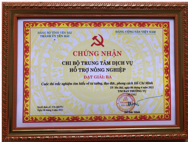
Chi bộ đạt giải Ba trong Cuộc thi trắc nghiệm tìm hiểu về tư tưởng, đạo đức, phong cách Hồ Chí Minh (2021)