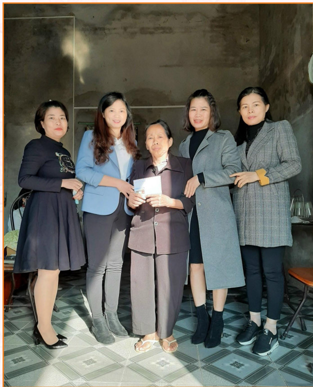
Trung tâm phối hợp với UBND phường Đồng Tâm thăm, trao quà cho hộ nghèo (2021)

Trong năm 2021, đơn vị tích cực tham gia thực hiện đề án giảm nghèo của thành phố. Phối hợp với phường Đồng Tâm trong việc hỗ trợ xây dựng nhà ở cho hộ nghèo, động viên tinh thần, vật chất, hướng dẫn phát triển kinh tế cho các hộ nghèo. Tích cực tham gia đóng góp các loại quỹ ủng hộ do các cấp phát động.