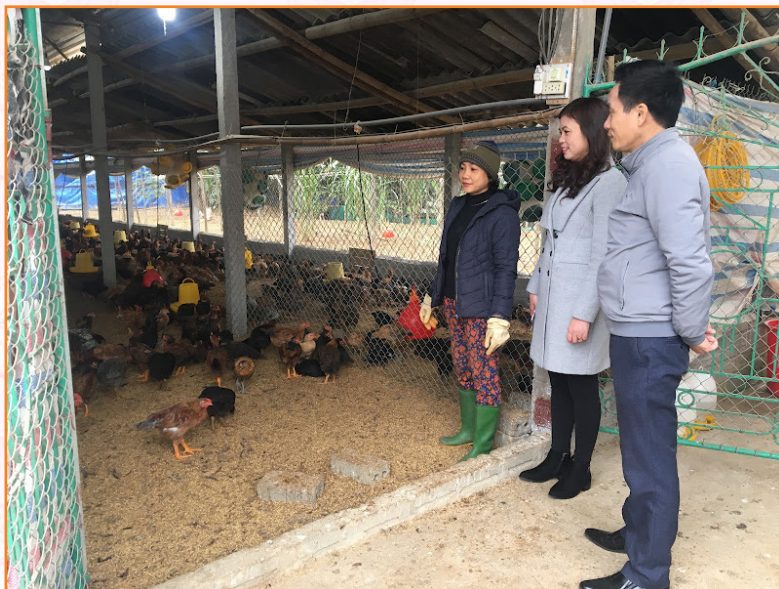
Kiểm tra công tác phòng bệnh trước Tết Nguyên đán năm 2021 cho đàn gia cầm tại xã Tuy Lộc