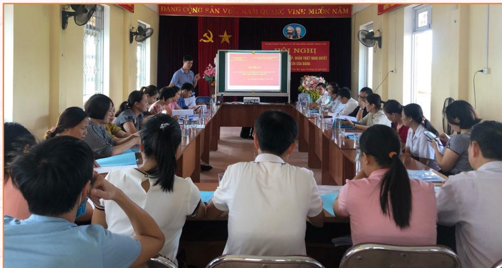
Cán bộ, viên chức Trung tâm tham gia tập huấn chuyên môn về chăn nuôi và thú y phòng, chống dịch bệnh động vật trên cạn (2021)