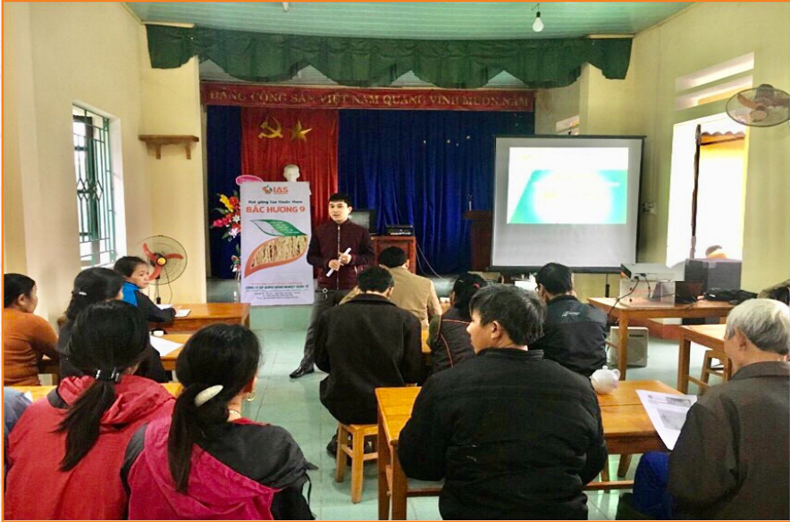
Trạm Khuyến nông tổ chức Hội nghị tập huấn hướng dẫn sử dụng phân bón cho cây trồng vụ Đông tại thôn Tuy Lộc, xã Văn Phú (2018)