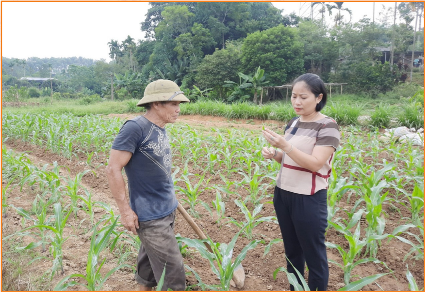
Cán bộ Trung tâm hướng dẫn các biện pháp phòng trừ sâu bệnh trên cây ngô vụ Hè - Thu (2020)