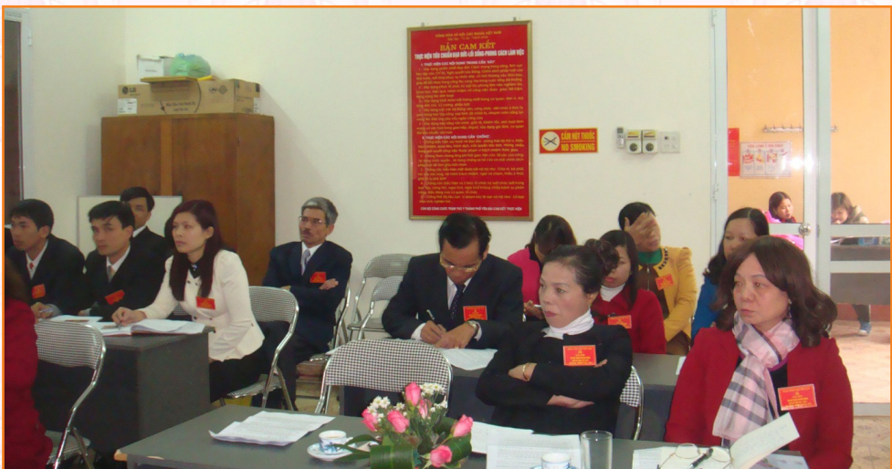
Đại hội Chi bộ Trạm Khuyến nông - Bảo vệ thực vật - Thú y lần thứ III, nhiệm kỳ 2015 - 2017