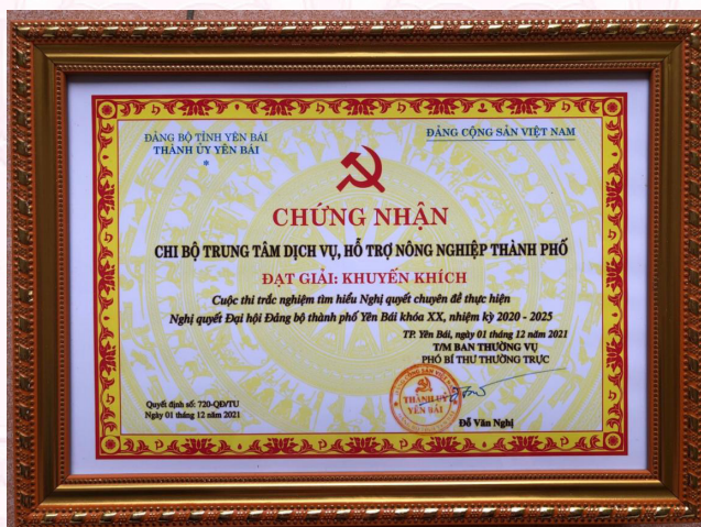
Chi bộ đạt giải Khuyến khích trong Cuộc thi trắc nghiệm tìm hiểu Nghị quyết chuyên đề thực hiện Nghị quyết Đại hội Đảng bộ thành phố Yên Bái khóa XX, nhiệm kỳ 2020 - 2025 (2021)