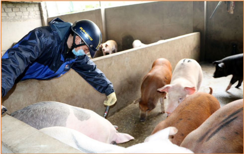
Cán bộ Trung tâm tiêm vắc xin phòng bệnh lở mồm long móng cho lợn trên địa bàn phường Nam Cường, thành phố Yên Bái (01/2019)

Dịch bệnh lở mồm long móng trên đàn lợn (từ ngày 11/01/2019 đến ngày 28/02/2019): Xảy ra ở 06/17 xã, phường (Nam Cường, Âu Lâu, Minh Bảo, Tân Thịnh, Yên Thịnh, Văn Phú). Tiêu hủy lợn của 14 hộ chăn nuôi với tổng số con 171 con (trong đó lợn nái: 21 con; lợn thương phẩm: 150 con), tổng trọng lượng 10.614 kg. Đã trực tiếp thực hiện tiêm bao vây trên các địa bàn có ổ dịch và địa bàn có nguy cơ cao gồm 09 xã, phường; tổng số lợn được tiêm vaccin là 7.531 con; phun tiêu độc khử trùng sau khi tiêm vaccin lở mồm long móng bao vây 17/17 xã, phường.