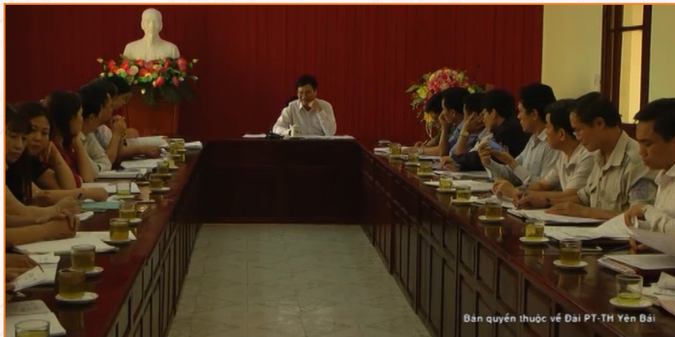
Thành phố Yên Bái triển khai kế hoạch phòng, chống dịch tả lợn châu Phi

tra các xe hàng bán thịt rong trên địa bàn thành phố. Thực hiện xác minh dịch bệnh dịch tả lợn châu Phi, tổ chức thực hiện việc giám sát, lấy mẫu và gửi mẫu xét nghiệm xác định vi rút dịch tả lợn châu Phi. Tổ chức phun tiêu độc khử trùng chống bệnh dịch tả lợn châu Phi những xã, phường có dịch và vùng bị uy hiếp.