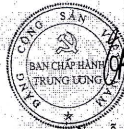
Nguyễn Phú Trọng

T/M BAN CHẤP HÀNH TRUNG ƯƠNG TỔNG BÍ THƯ